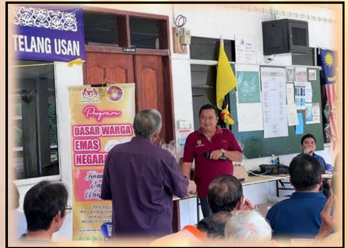
Sesi soal jawab bersama komuniti semasa ceramah Bahaya Gigitan Rabies.