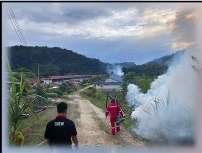
Aktiviti fogging untuk program pemusnahan tempat pembiakan nyamuk Aedes.