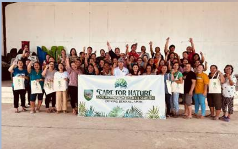
Program Care For Nature 2.0 di Long Bemang bersama Komuniti Long Bemang.

Care For Nature 2.0 telah dilaksanakan pada 11 hingga 15 September 2023 bertempat di Long Bedian dan Long Bemang dan program ini kolaborasi bersama Majlis Bandaraya Miri (MBM), JKKK Long Bedian dan Long Bemang. Antara aktiviti yang dijalankan adalah seperti ceramah pengenalan matlamat pembangunan mampan, 3R-pengasingan sisa pepejal dan baja kompos.