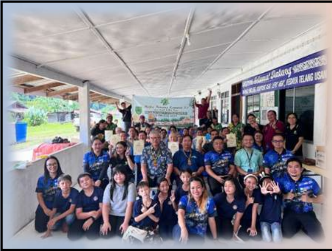
Gambar bersama dengan komuniti di Long Jeeh setelah selesai program.