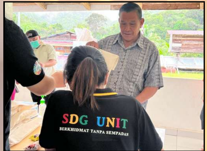
Sesi pemberian kit peserta.