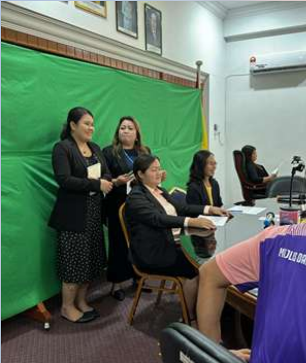
Sesi Pembentangan Kumpulan Serakup Indu Dayak Sarawak (SIDS) Marudi pada 23 November 2023.

Pameran Inno-Waste Sempena Minggu Inovasi Perkhidmatan Awam Sarawak Tahun 2023 dilaksanakan pada 23 sehingga 26 November 2023 bertempat di Dewan Masyarakat Bekenu, Subis dengan kerjasama Serakup Indu Dayak Sarawak (SIDS) Cawangan Marudi. Antara aktiviti yang dilaksanakan adalah seperti pameran produk 3R, pameran produk komuniti SIDS, pertandingan pameran inno-waste dan ceramah From Waste to Cash .