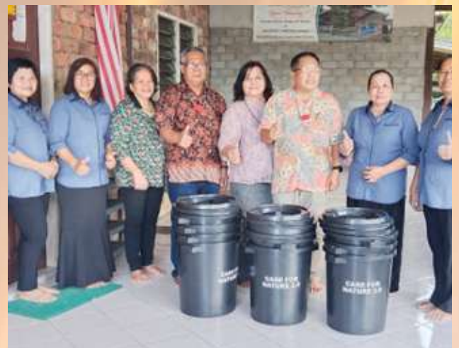
Sumbangan Tong Bokashi kepada komuniti Long Bedian untuk menjalankan aktiviti kompos.